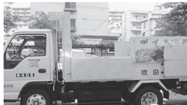
吹田市のごみ収集車

本部審査会での口頭意見陳述にあたっては、「何をしたら認められるだろうか」と議論し、DVD上映では「事故当時の状況を十分に再現しきれなかったのではないかと反省して、実演を行うことに。また、中央労働災害防止協会が発表した「腰痛の予防対策に関する調査研究委員会報告書」などの資料を添えて「単に重量や滑りやすさだけで判断するのではなく、自らの熟練度が低下していることを認識